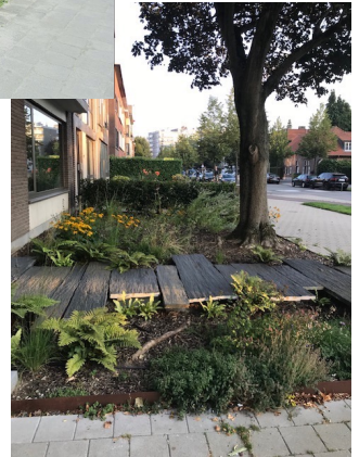
5 Berchemboslaan 2a schaduwplanten, bloembollen