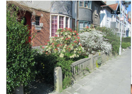
15 Hugo Verrieststraat 29 sierstruiken, heesters