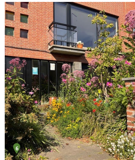
Apollostraat 69 Insectvriendelijke voortuin, bloembollen, ontharding